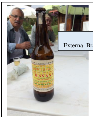
Momento em que os Ir.: discutiam a Política Externa Brasileira, em especial as relações do Brasil com

O sábado chegou e como sempre um grupo de Cunhadas deslocaram-se para Friburgo para “pequenas” compras, enquanto que os Ir.: ficavam tentando resolver os problemas do Brasil e do Mundo.