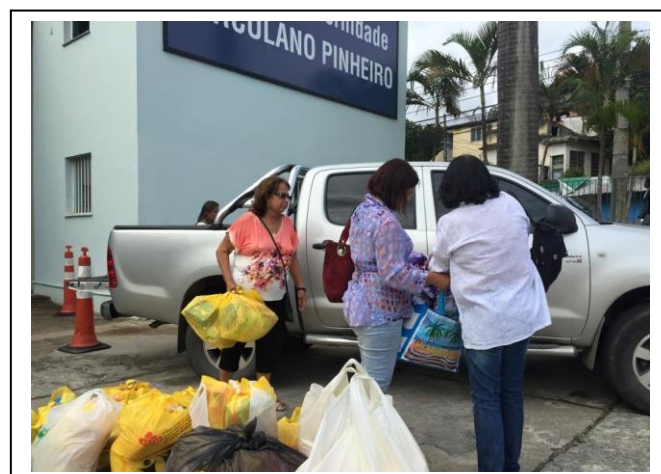
Felizes por mais uma missão cumprida.