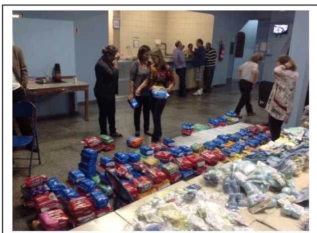
Vista parcial do material para a montagem dos “Kits”